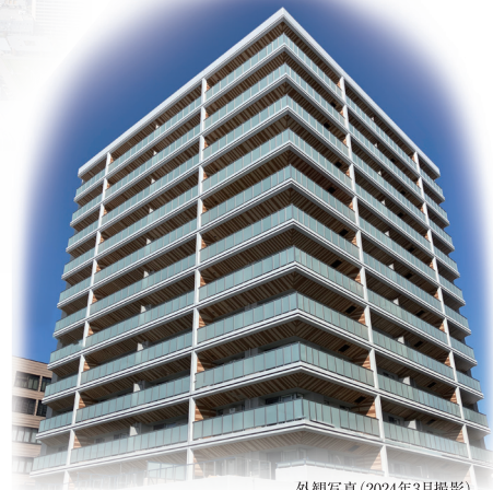
外観写真(2024年3月撮影)

【来場予約受付中】モデルルームご見学のお客様は、 マンションギャラリーまでお越しください。